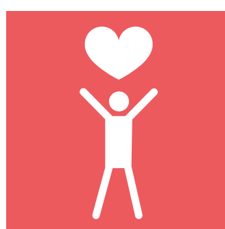
S'ENGAGER EN PASSIONNÉ