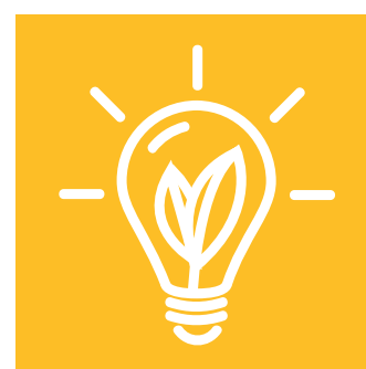
COMMERCER EN CITOYEN