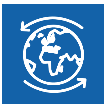
ACHETER EN PARTENAIRE

Maisons du Monde décide d'inscrire son projet sociétal dans le cadre d'une fondation sous l'égide de la Fondation Nicolas Hulot.