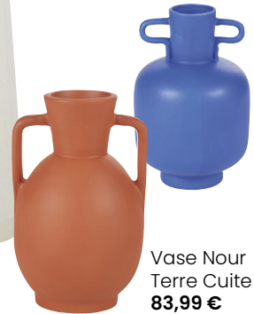
Vase Nour Terre Cuite 83,99 €