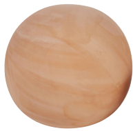
Boules Moon Argile 69,99 €