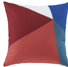
Coussin Moreno Polyester 19,99 €