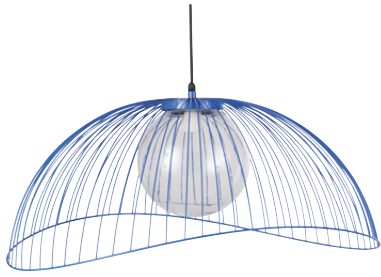
Suspension Buenos Aires Métal 179,00 €