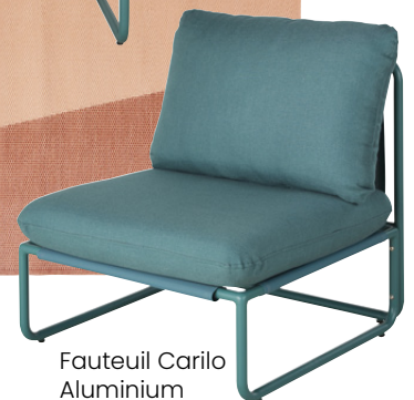
Fauteuil Carilo Aluminium 279,00 €