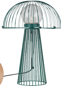
Lampe Buenos Aires Métal 139,00 €