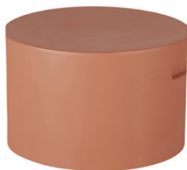
Bout de canapé Juan Magnésium 119,00 €