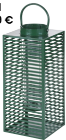
Lanterne Melva Métal 65,99 €