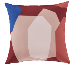
Coussin Pinamar Polyester 19,99 €