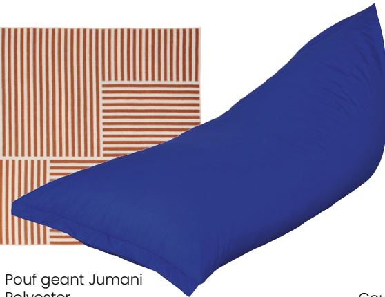
Pouf geant Jumani Polyester 129,00 €