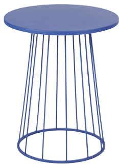
Bout de canapé Tempka Fer 49,99 €