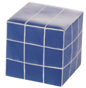
Cubes Buenos Aires Grès 139,00 €