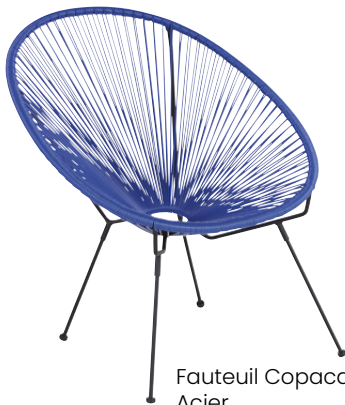
Fauteuil Copacabana Acier 69,99 €