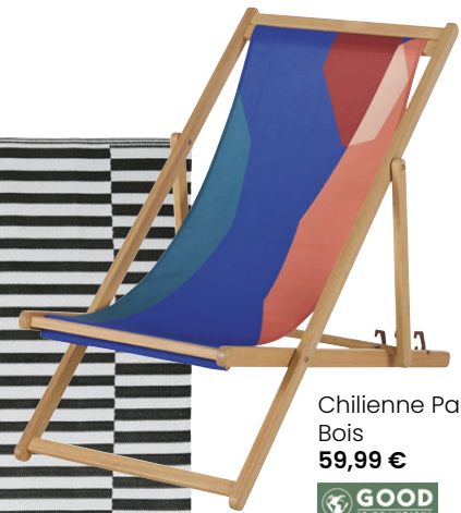
Chilienne Panama Bois 59,99 €