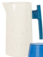
Pichet Zurich Grès 26,99 €