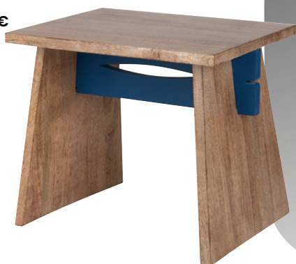
Bout de canapé Lary Bois 79.99€