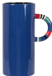
Vase Vitor Porcelaine 24.99 €