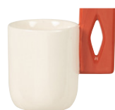
Mug Peter Grès 4.99€