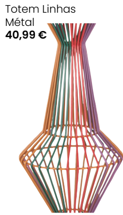
Totem Linhas Métal 40,99 €