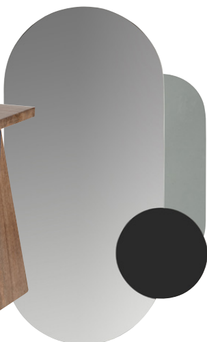
Miroir Cabura 59.99 €