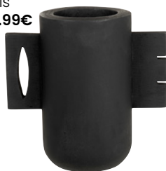
Vase No Bois 32.99€