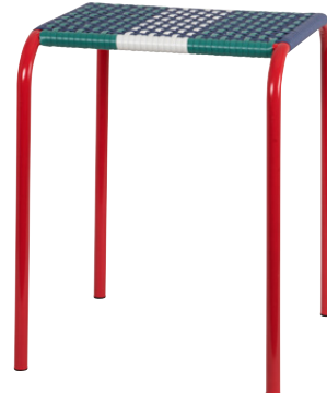
Tabouret Scoubidou Polyéthylène 62.99€