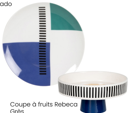
Coupe à fruits Rebeca Grès 24.99€