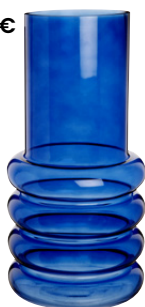
Vase Leandro Verre 22.99 €