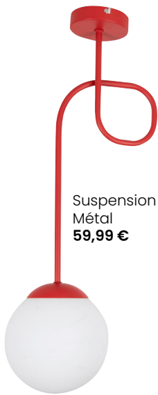
Suspension Petropolis Métal 59,99 €