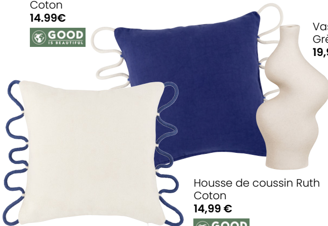
Vase Ourea Grès 19,99 €