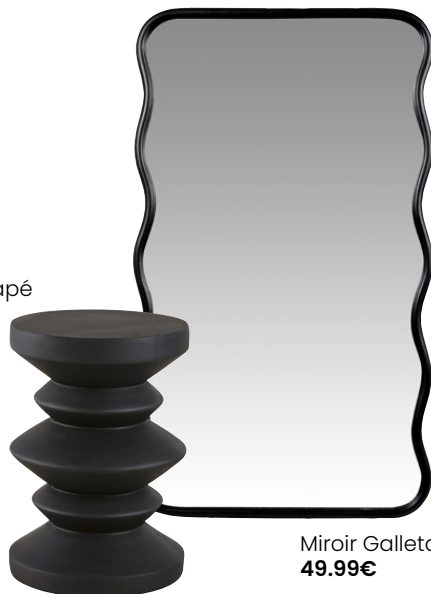
Miroir Galleta 49.99€