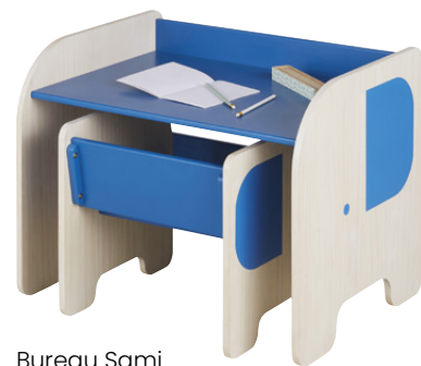
Bureau Sami Panneau fibres moyenne densité 129,99 €