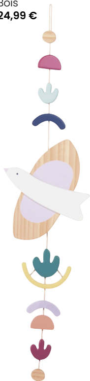
Guirlande Wynwood Bois 24,99 €