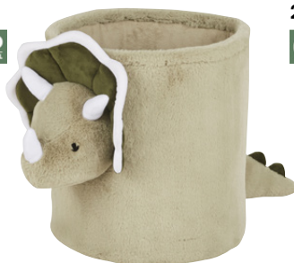
Peluche Yago Polyester 25,99 €