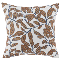
COUSIN RANDERS Polyester 19,99 €