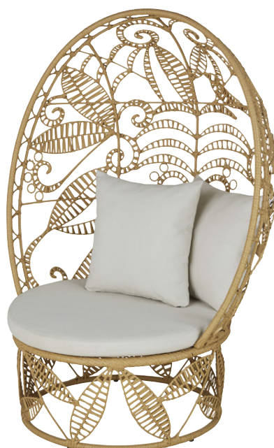
FAUTEUIL OEUF ARASARI Métal 498,00 €