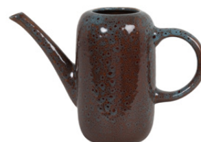
ARROSOIR LINA Porcelaine 29,99 €