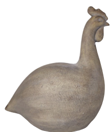
POULE SIMEON Résine 69,99 €