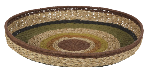
COUPE ARAQUARA Papier 59,99 €