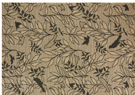
TAPIS BAZA Polypropylène 99,99 €