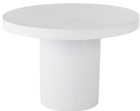
TABLE RONDE BAYAN Polyrésine 899,00 €