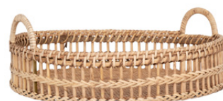
PLATEAU TRESSE ALANO Rotin 39,99 €