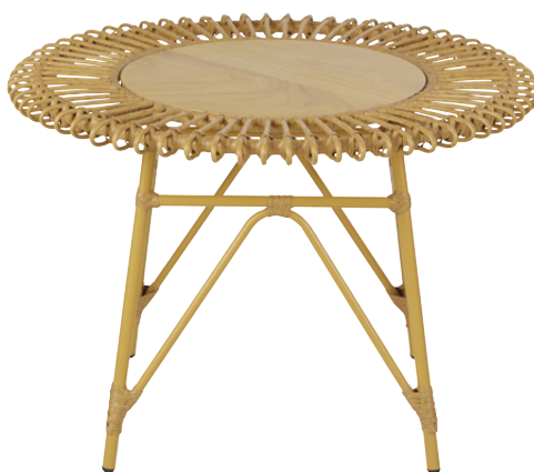
BOUT DE CANAPÉ CASIMI Polyéthylène 129,00 €