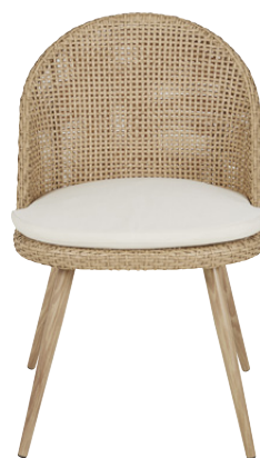
LOT DE 2 CHAISES MELIO CANNEE Aluminium 259,00 €