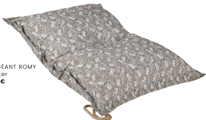
POUF GÉANT ROMY Polyester 179,00 €