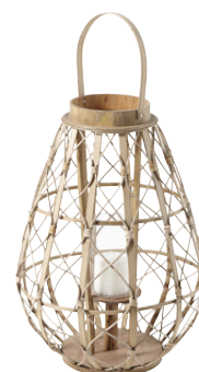
LANTERNE BELEM Bambou 49,99 €