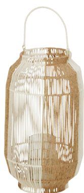
PHOTOPHORE ARSENE Métal 62,99 €