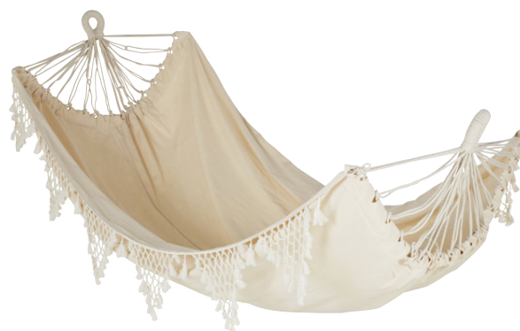
HAMAC MERCADORA Coton 149,00 €