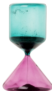
SABLIER NEREID Verre 25,99 €