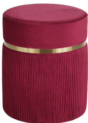
POUF PAMONA Polyestère 69,99 €