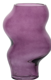
VASE DORIS Verre 14,99 €