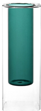
VASE ANDRO Verre 32,99 €