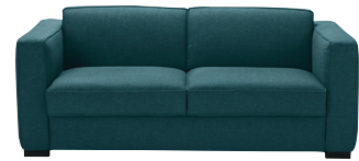
Canapé convertible Berlin 1 699,00 €