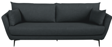
Canapé Prague 899,00 €