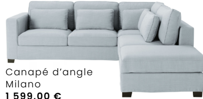
Canapé d'angle Milano 1 599,00 €