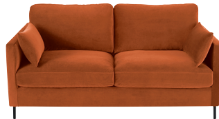
Canapé convertible Julian 1 199,00 €