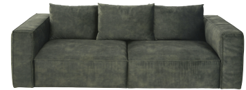
Canapé Barack 1 199,00 €