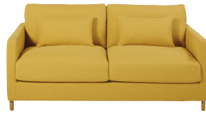
Canapé Julian 759,00 €