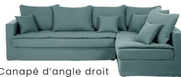
Canapé d'angle droit Célestin 1 899,00 €