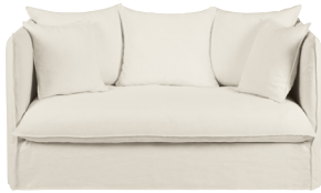
Canapé convertible Louvain 1 399,00 €