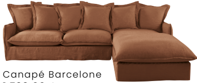
Canapé Barcelone 1 799,00 €