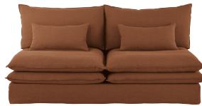
Chaufeuse Pompei 1 099,00 €