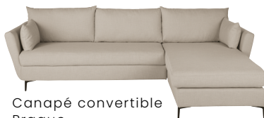
Canapé convertible Prague 1 999,00 €