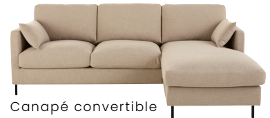
Canapé convertible Julian 1 499,00 €