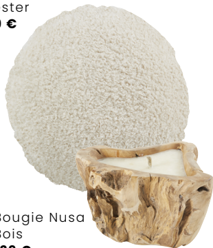
Bougie Nusa Bois 129 €