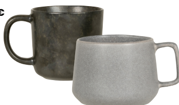
Mug beton Grès 5,99 €