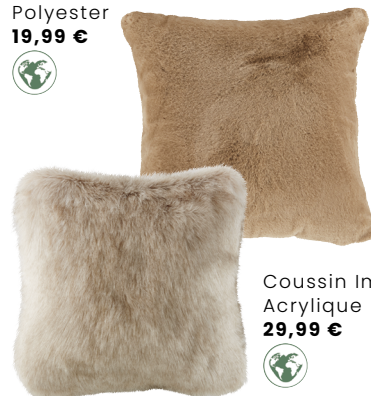
Coussin Imeon Acrylique 29,99 €