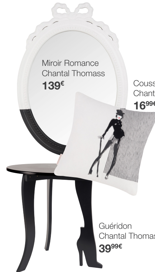
Miroir Romance Chantal Thomass 139€