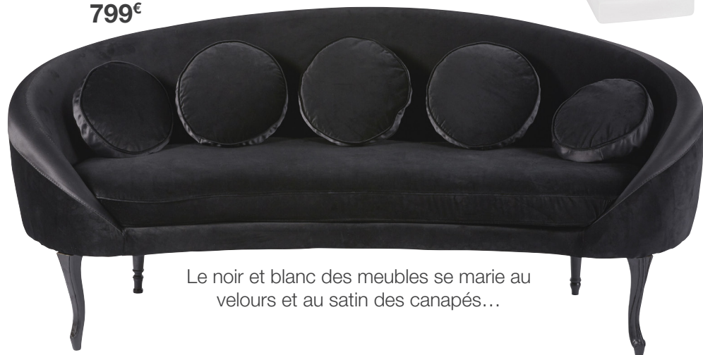
Canapé Chantal Thomass 799€