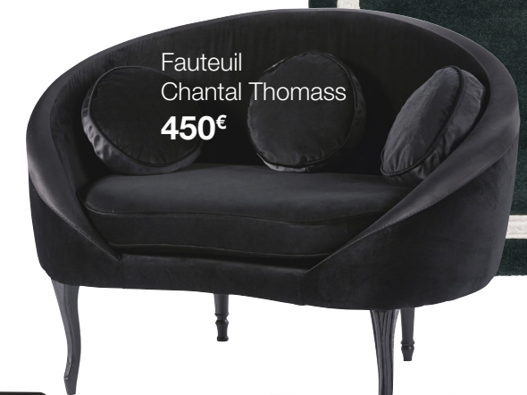
Fauteuil Chantal Thomass 450€