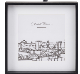
Cadre Toits de Paris Chantal Thomass 599€