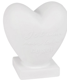
Lampe Cœur Chantal Thomass 2499€