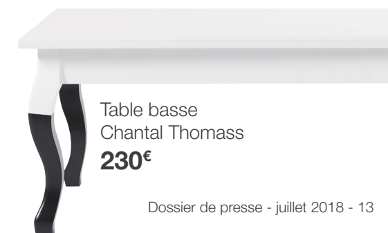
Table basse Chantal Thomass 230€