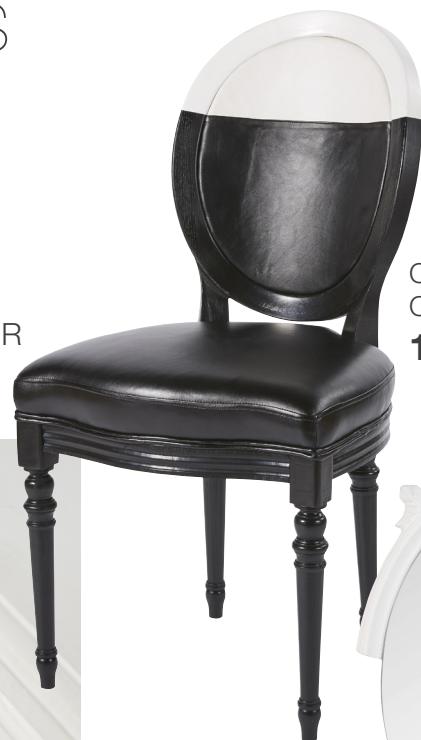
Chaise Louis Chantal Thomass 199€

NOUVELLE PIÈCE À VIVRE... LA SALLE À MANGER PREND DES AIRS DE BOUDOIR... ET SAIT SE TRANSFORMER POUR UN DÎNER CHIC.