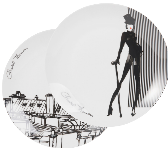
Assiette Chantal Thomass à partir de 4,59€

Les objets de décoration, les luminaires et l'art de la table illuminent la pièce d'une élégante harmonie.