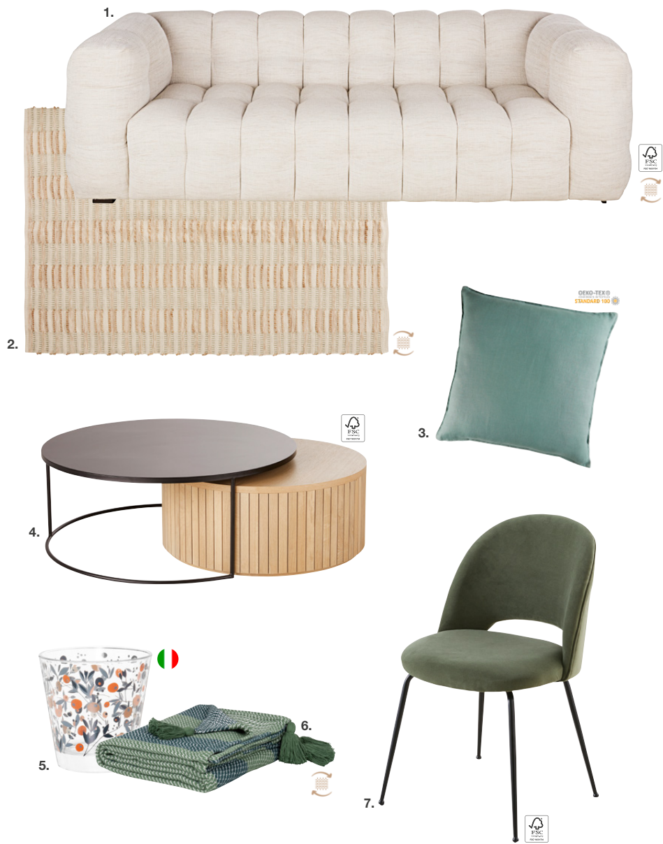
1. Canapé Lilo en bois certifié et textile recyclé L240 x PR102 x H76 cm 1099 € - 2. Tapis Pescara en coton et jute L140 x H200 cm 99,99 € - 3. Coussin Jade en lin lavé L60 x H60 cm 29,99 € - 4. Tables gigognes Boldin en bois certifié L100 x PR100 x H40 cm 539 € - 5. Gobelet motif floral en verre L8.6 x PR8.6 x H8.7 cm 1,99 € - 6. Jeté Lota en coton recyclé L160 x H210 cm 49,99 € - 7. Chaise Isys en velours et bois certifié L51 x PR54 x H81 cm 139 €