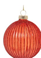
Boule striée glitters en verre 2,59 €