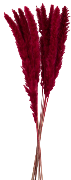
Mini pampas Gand en élément naturel séché 12,99 €