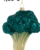
Pendant brocoli en verre 4,99 €