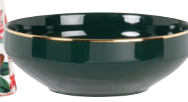
Coupelle Bérénice en porcelaine 5,99 €