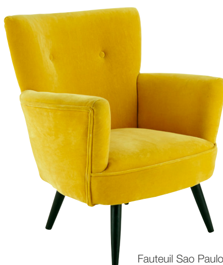
Fauteuil Sao Paulo en bois 429,00 €