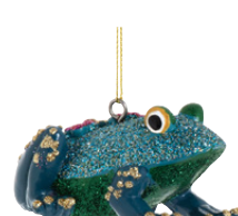
Pendant grenouille en polyrésine 3,99 €