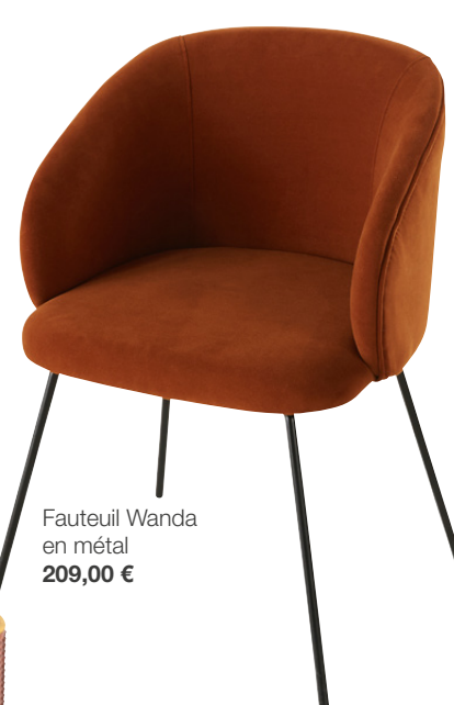
Fauteuil Wanda en métal 209,00 €

Maisons du Monde est le leader européen de la Maison inspirante et accessible. Une marque d'ouverture et d'échange qui fédère ses 7,5 millions de clients autour des lifestyles désirables et durables. Des univers Maison multi-styles que l'on retrouve dans les collections constamment renouvelées du meuble à la décoration. Optimisme, créativité, engagement et proximité sont au cœur des valeurs de la marque, qui s'appuie sur un modèle omnicanal hautement performant. Digitalisation, conseils personnalisés, et depuis peu la marketplace avec plus de 95 modes uniques, chaleureux et durables. ». En 2022, Maisons du Monde a également lancé son mouvement de marque Good is Beautiful autour de 5 engagements afin d'ancrer définitivement le développement durable dans sa stratégie. Pour que le beau ne vive plus sans le bon. Une offre et des engagements à retrouver sur www.maisonsdumonde.com .