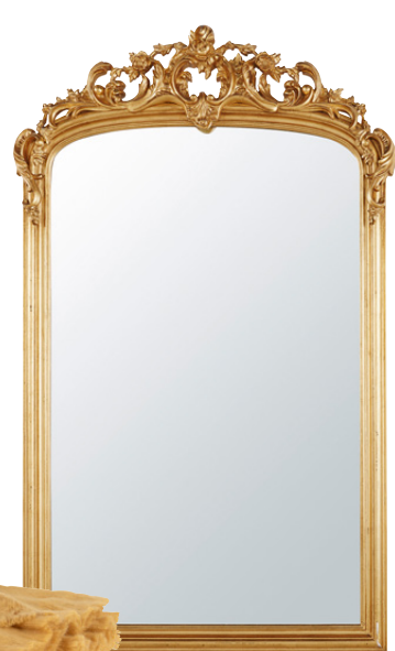
Miroir Arthur en polyrésine 379,00 €