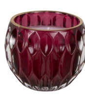
Bougie Jowella 9,99 €