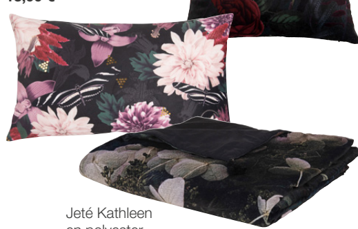
Jeté Kathleen en polyester 69,99 €