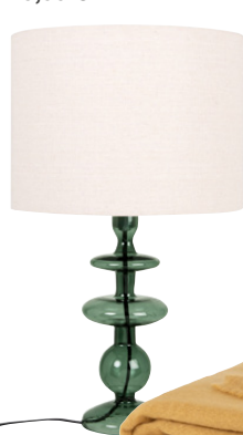
Jeté Muraco en polyester 39,99 €