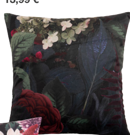
Housse de coussin Janice en polyester 13,99 €