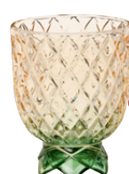
Gobelet pied ananas en verre 4,59 €