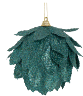
Boule écaille en polyester 1,99 €