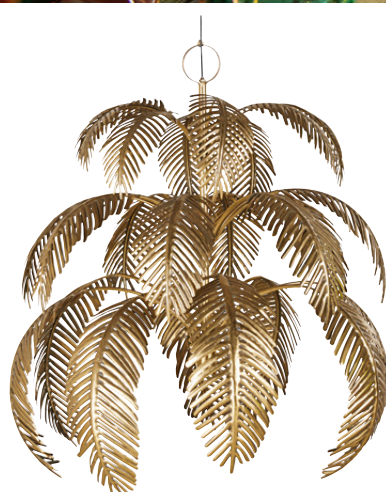
Suspension Veronetta en métal 289,00 €