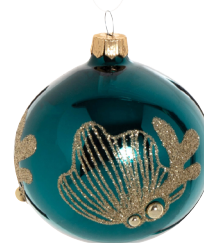
Boule perle corail Made in Pologne 3,99 €