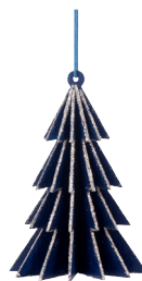
Sapin relief bleu nuit et doré Certifié bois responsable 2,99 €