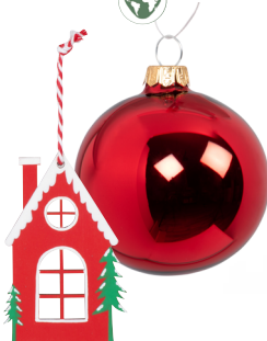
Pendant maison Certifié bois responsable 0,70 €