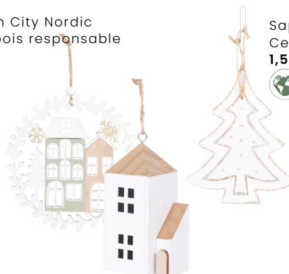
Sapin beige et doré Certifié bois responsable 1,59 €