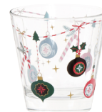
Gobelet Noël tradi Made in Italie 2,59 €