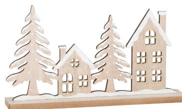
Décoration paysage Certifié bois responsable 4,99 €