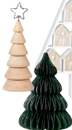
Papier piage vert Certifié bois responsable 13,99 €